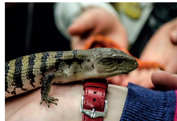
Tiere kennen lernen