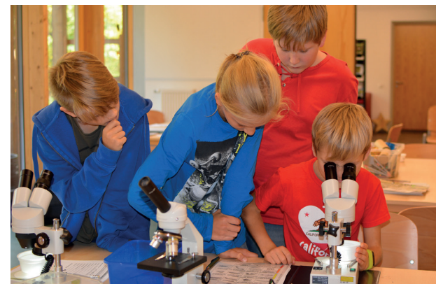
Lebewesen mit dem Binokular entdecken