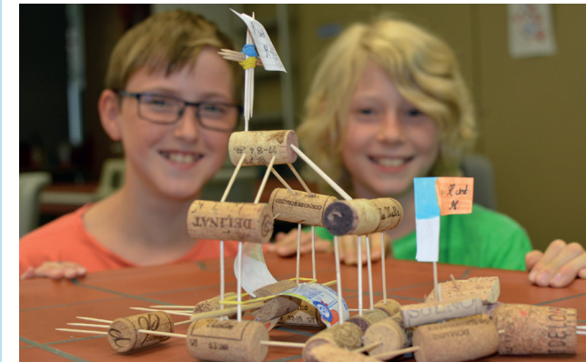
Korkboot mit Antrieb

Bei Interesse kann im Anschluss an die Forscherklasse ein Wahlkurs im MINT-Bereich belegt und in der achten Jahrgangsstufe der naturwissenschaftlich-technologische Zweig gewählt werden.