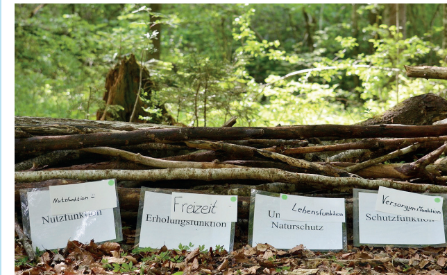
Projektarbeit im Bergwallerlebniszentrum

Hinweis: Die Einrichtung von Profil- und Wahlkursangeboten hängt von der Anzahl der interessierten Schülerinnen und Schüler sowie der verfügbaren Lehrkräfte ab.