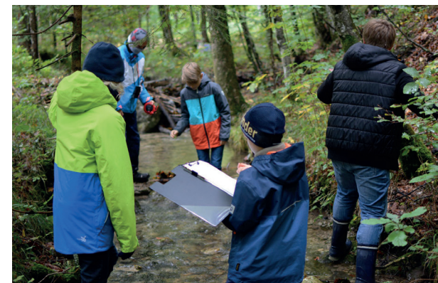
Biologie im Freien

Im Folgenden beantworten wir einige häufig gestellte Fragen zu unseren Profilklassen.