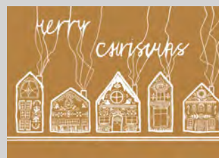
K 02 Lebkuchenhäuser