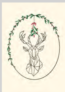
K 01 Hirsch