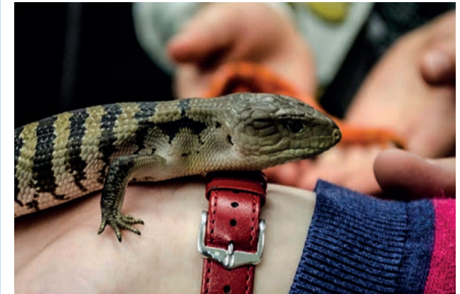
Tiere kennen lernen