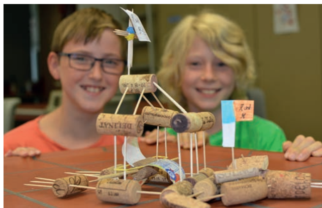
Korkboot mit Antrieb

Bei Interesse kann im Anschluss an die Forscherklasse ein Wahlkurs im MINT-Bereich belegt und in der achten Jahrgangsstufe der naturwissenschaftlich-technologische Zweig sowie zusätzlich die Tablet-Klasse gewählt werden.