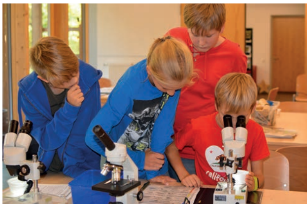
Lebewesen mit dem Binokular entdecken