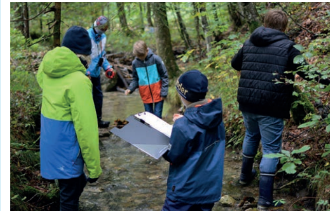
Biologie im Freien